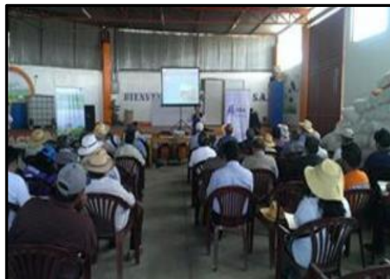
Taller de involucrados – Maynas