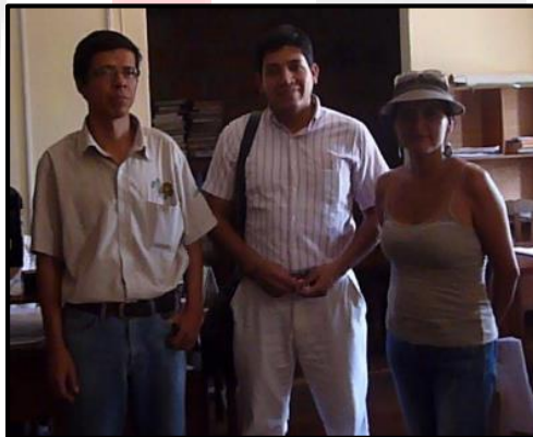
Entrevistas a involucrados, Pucallpa